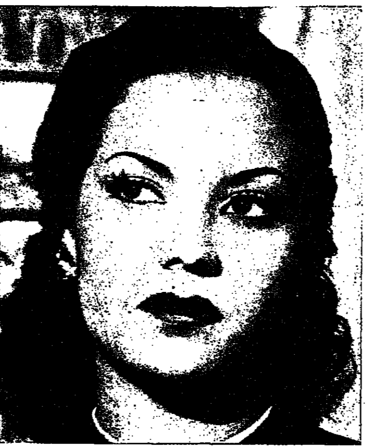
من الأرشيف عيون الفنانة مهيبة يسرى مهت لها الشهرة

كنت اعتقد ان تقدر هذا الشعور في اعماقي سيجعلني بعداً عنك، انك المثل التي انساني اسمي لم ينقطع بي إلى مقترق طريق حديد لم ينقطع عيني على مفاخرة أو حكاية حب جديدة... بل على العكس! لقد ايقظ في اعماقي كل حبي لك الذي اخذت ثورته لتكون مثل العاشقين ويستمر حياً دوماً... والشكلة انك تعلمت الهوده والأطمئنان إلى حب لا يعرف التوراة، وبيدات تستغرب حين يرون رفضه للقواعد التي رسمناها... وبيدات تمارس الدور الذي مارسته أنا من قبل، وتعاوون اثنائي بابهية المعنى في الحب - لا تفرق بين شعوره من الداخل بغض من الاتكاز اليوم كل حواجز الصمت، ولن تستطيع الرجوع إلى سنوات التفتت وكبت الانفعالات... وان اقل لحيننا ان يكون مجرد شجرة لا تزهر ولا تنشق لريبعها، ولا تقاير على عنينا! لم يعد يعني ان يوم حينها دعراً اذا كان العقل وحده هو السيل، وكل ما اتناه اليوم هو ان اعيش الحب بتفكيره ومزاجه ولو تشهور او أيام، أريد ان أعود عاشقة.